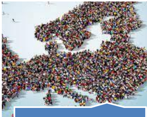
Inclusione e diversità