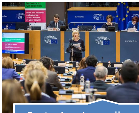
Partecipazione alla vita democratica