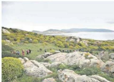
Una escursione nel Parco nazionale dell'Asinara

«La Cets è la più importante certificazione europea delle aree protette che intendono applicare i principi dello sviluppo sostenibile al proprio territorio - ha aggiunto Sammuri -, attraverso il coinvolgimento della comunità locale e degli opera-