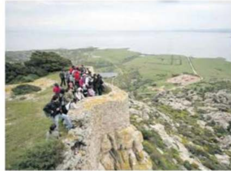
Una escursione all'isola-parco