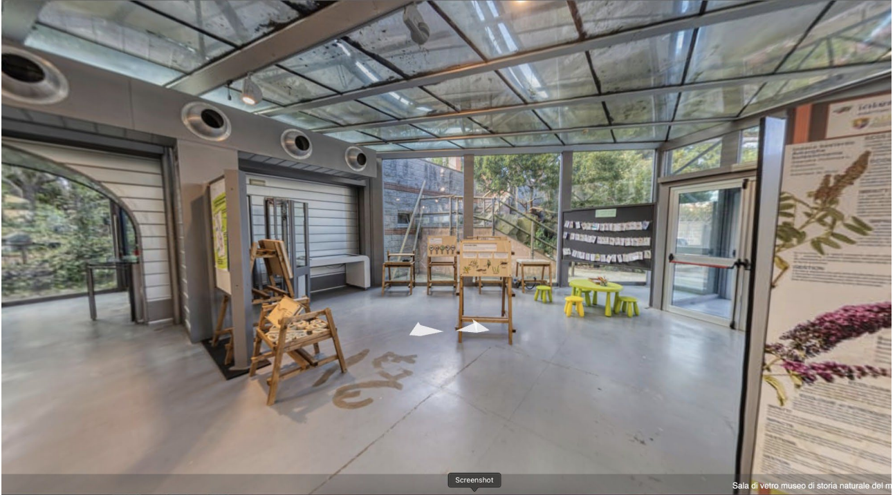
Sala di vetro museo di storia naturale del m