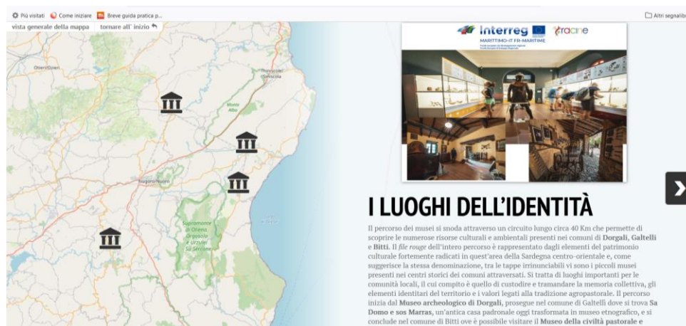
Figure 11 : Itinéraire "Dorgali, Galtelli et Bitti : lieux d'identité", rendu par l'outil storymap.

Ci-dessous une capture d'écran du meilleur produit réalisé avec des étudiants universitaires enseignant la géographie du tourisme, l'itinéraire "Dorgali, Galtelli et Bitti : lieux d'identité" (Fig.5)