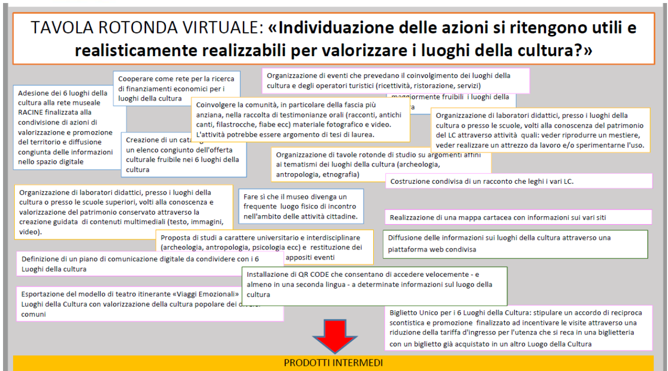
Figura 1: L'insieme di contributi emersi nell'ambito dei percorsi partecipativi condotto con i luoghi della cultura e la comunità del territorio nuorese.