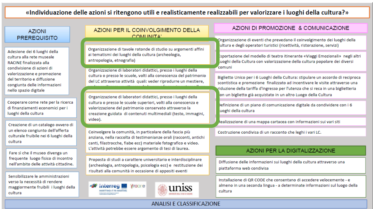
Figura 2: La classificazione dei contributi emersi nell'ambito dei percorsi partecipativi condotto con i luoghi della cultura e la comunità del territorio nuorese. Sono evidenziate le azioni individuate come più utili e realisticamente realizzabili ai fini dell'obiettivo specifico 1.2: il museo come luogo fisico di incontro nell'ambito delle attività cittadine.