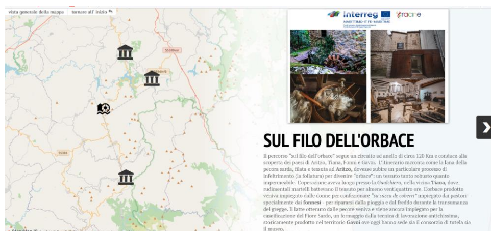
Figure 10 : Itinéraire "On the Orbaceous Edge", rendu par l'outil storymap.

Voici la capture d'écran du meilleur produit réalisé avec les élèves du lycée de Gavoi, l'itinéraire "Sur le fil d'Orbace" (Fig.4).