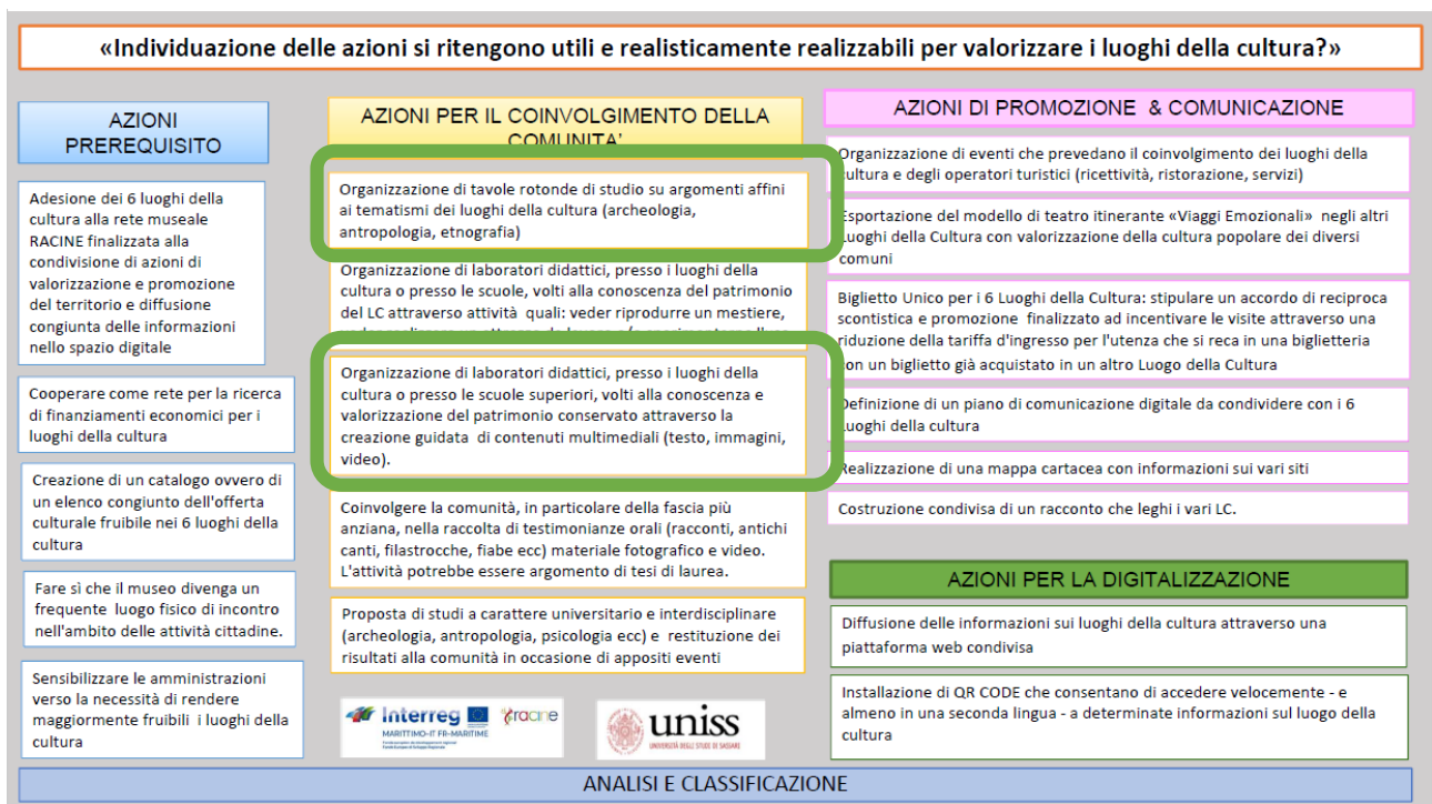
Figure 8 : La classification des contributions qui ont émergé dans le cadre des parcours participatifs menés avec les lieux culturels et la communauté du territoire de Nuoro. Les actions identifiées comme les plus utiles et réalisables aux fins de l'objectif spécifique 1.2 : le musée comme lieu de rencontre physique au sein des activités de la ville sont mises en évidence.