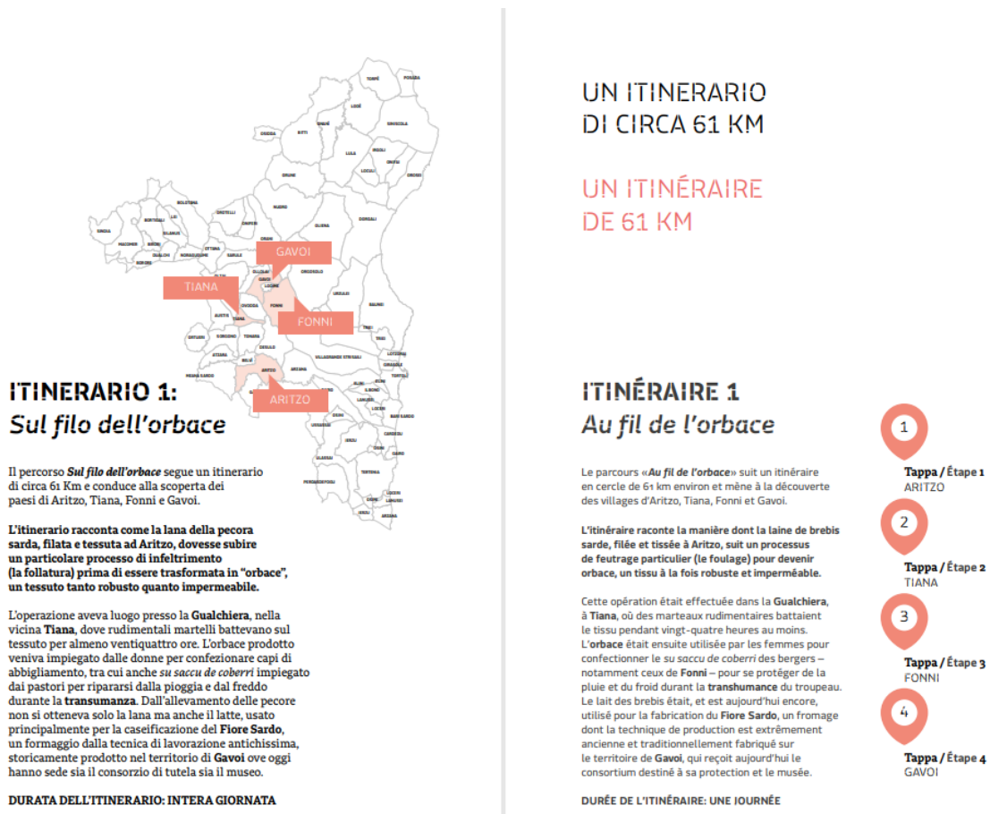
Figure 12 : Le produit éditorial "Lieux, identité et culture dans la région de Nuoro. Le projet RACINE" (produit T1.2.2), pp. 69-70.

Les itinéraires ont été inclus dans la plateforme multimédia www.progettoracinenuorese.it (I15.1.1) dans la section "Itinéraires" et sont décrits et valorisés dans le produit éditorial " Lieux, identité et culture dans le territoire de Nuoro ". Le projet RACINE" (T1.2.2) une publication à caractère scientifique qui décrit et promeut les musées de Nuoro impliqués dans le projet.