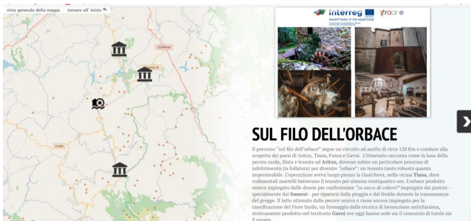
Figura 4: Itinerario "Sul Filo dell'orbace", reso attraverso lo strumento storymap.

Qui di seguito lo screenshot del miglior prodotto realizzato con gli studenti dell'Istituto Superiore di Gavoi, l'itinerario "Sul filo dell'Orbace" (Fig.4)