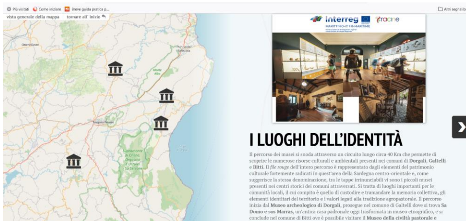
Figura 5: Itinerario "Dorgali, Galtelli e Bitti: i luoghi dell'identità", reso attraverso lo strumento storymap.

Qui di seguito lo screenshot del miglior prodotto realizzato con gli studenti universitari dell'insegnamento di Geografia del turismo, l'itinerario "Dorgali, Galtelli e Bitti: i luoghi dell'identità" (Fig.5)