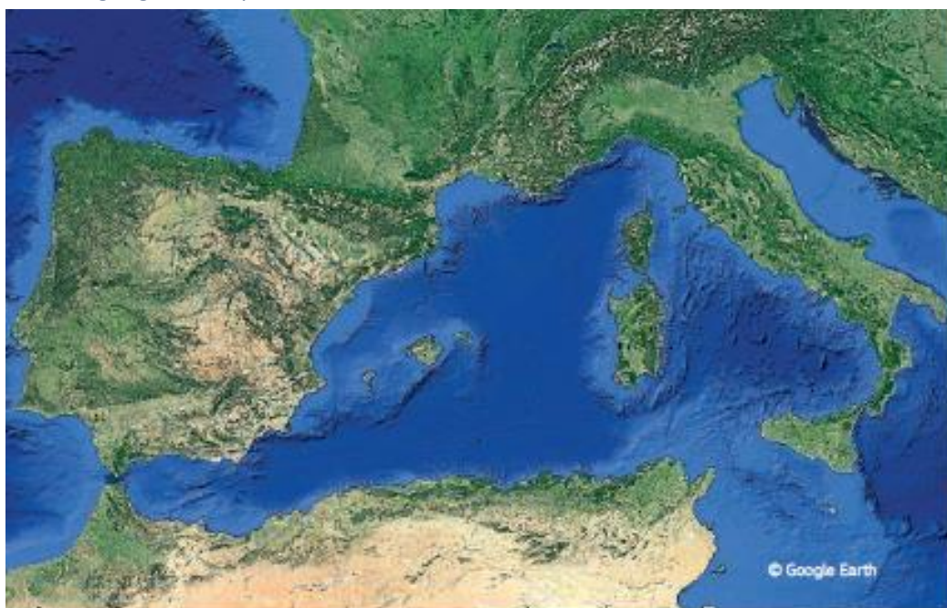
Figura 3 Area geografica coperta dall'iniziativa WestMED

Conformemente a quanto previsto nel piano operativo annuale, in questa sezione si provvede ad una prima analisi di coerenza tra la strategia seguita dal programma Italia-Francia Marittimo 2014-20 e le priorità dell'iniziativa WestMED, strategia marittima nell'area della quale ricade il programma (mappa sotto riportata) 1 e riferimento per la prossima programmazione. L'iniziativa comprende i paesi delle due sponde del Mediterraneo, ovvero: Spagna, Francia, Italia, Portogallo, Malta, Mauritania, Marocco, Algeria, Tunisia e Libia.