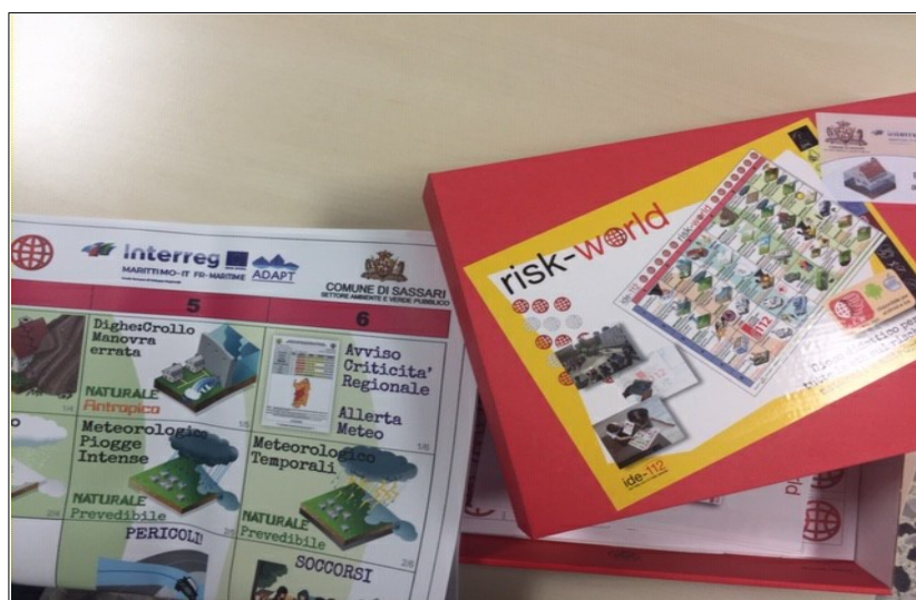
foto 2 – Gioco da tavolo (particolare logo ADAPT)/ photo 2 - Jeu de société (détail du logo ADAPT)