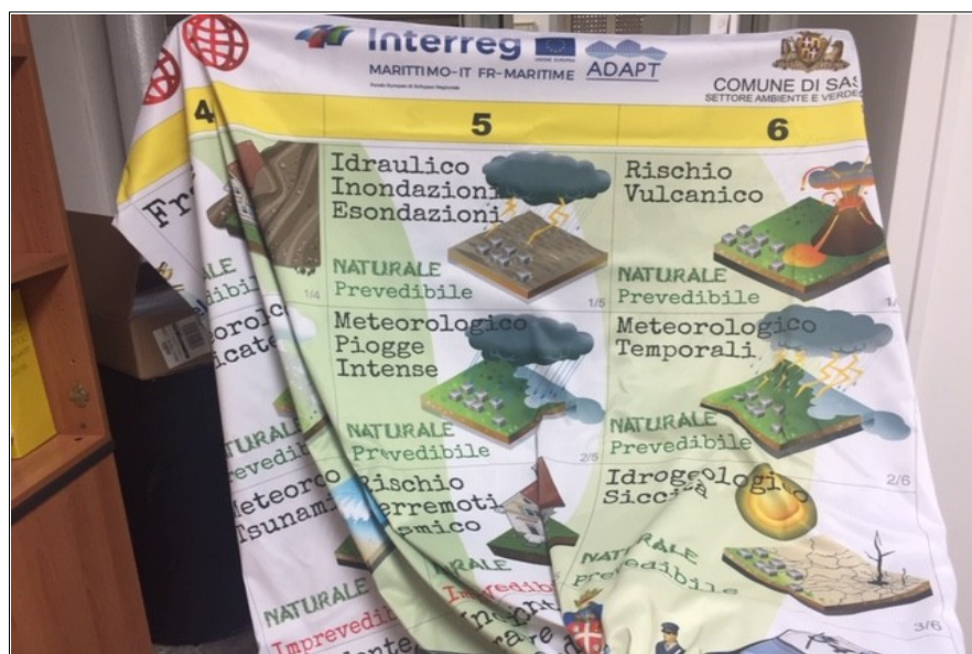
foto 3 – Pannello (con particolare logo ADAPT)/photo 3 - Panneau (avec détail du logo ADAPT)