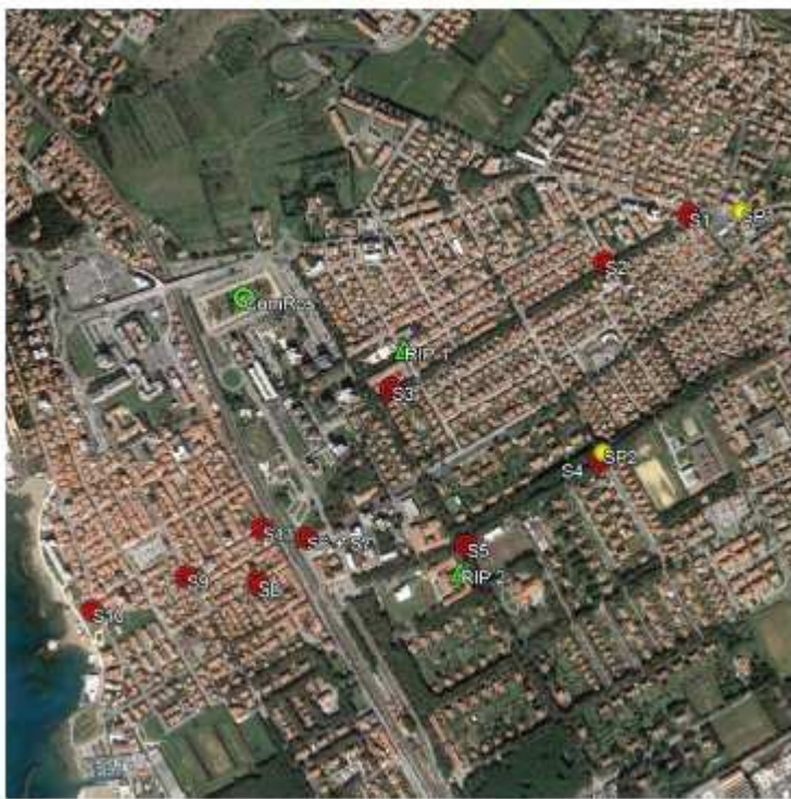
UBICAZIONE DELLA STRUMENTAZIONE