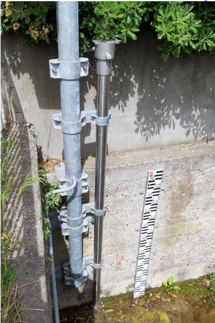
L'idrometro e l'asta graduata installata nel Botro Cotone L'hydromètre et la tige graduée installés dans le Botro Cotone