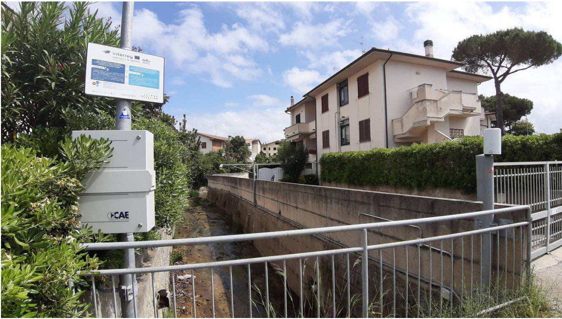
La stazione installata sul Botro Cotone con pluviometro e webcam La station installée sur le Botro Cotone avec pluviomètre et webcam