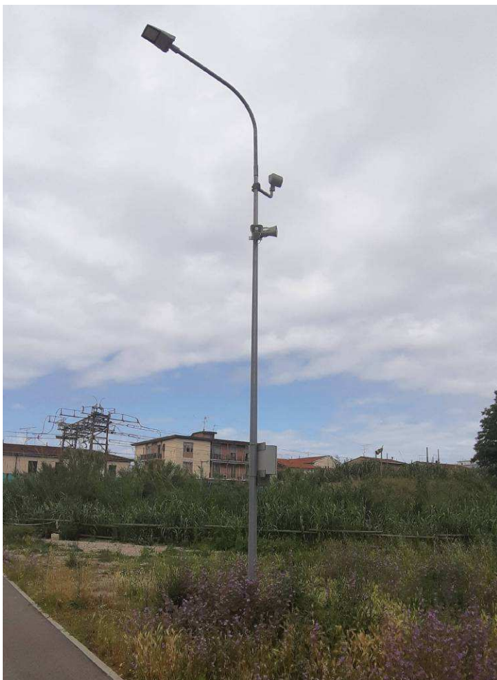
Alcune delle sirene installate nei pressi del tombamento del Botro Cotone Quelques sirènes installées près du tombeau du Botro Cotone