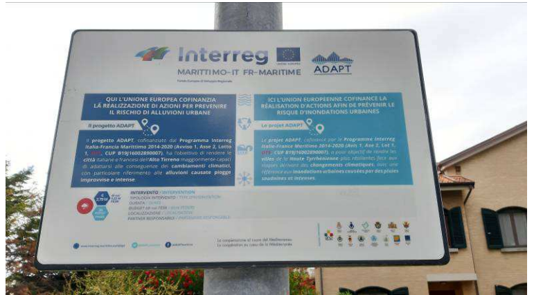
La stazione ubicata nei pressi del Botro Secco con il particolare della targa permanente La station située près du Botro Secco avec le détail de la plaque permanente