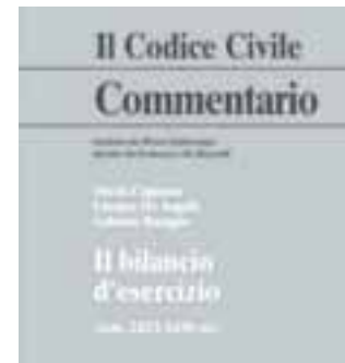
La copertina del volume

Il libro di Racugno Una guida sul bilancio d'esercizio