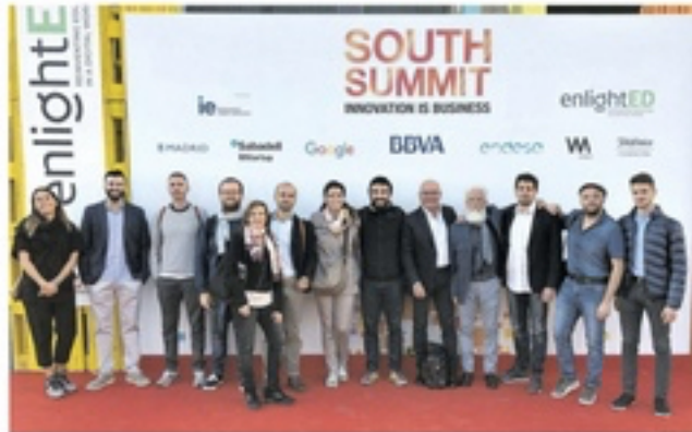
La delegazione di Marittimo Tech alla fiera di Madrid

DALLA SARDEGNA AL MONDO GRAZIE A MARITTIMOTECH