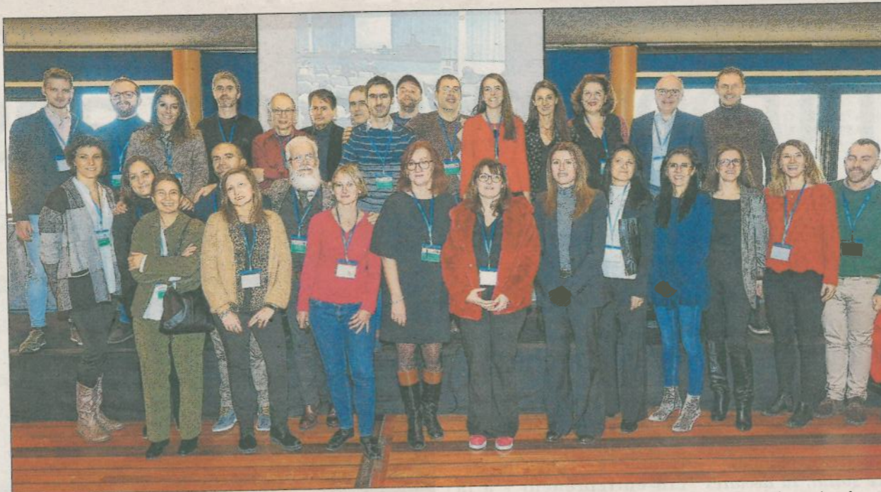
Les partenaires du dispositif transfrontalier ont participé à une journée de bilan hier, au Palais des congrès d'Ajaccio.

Grâce à cet accélérateur transfrontalier financé par le programme européen Interreg Italie-France Marittimo 2014-2020, quarante-cinq start-up ont en effet été soutenues dans leur développement à l'échelle de cinq régions du bassin méditerranéen - Ligurie, Sardaigne, Toscane, Paca et Corse -, dans quatre filières clefs, à savoir le nautisme, le tourisme durable, les biotechnologies et les énergies renouvelables.