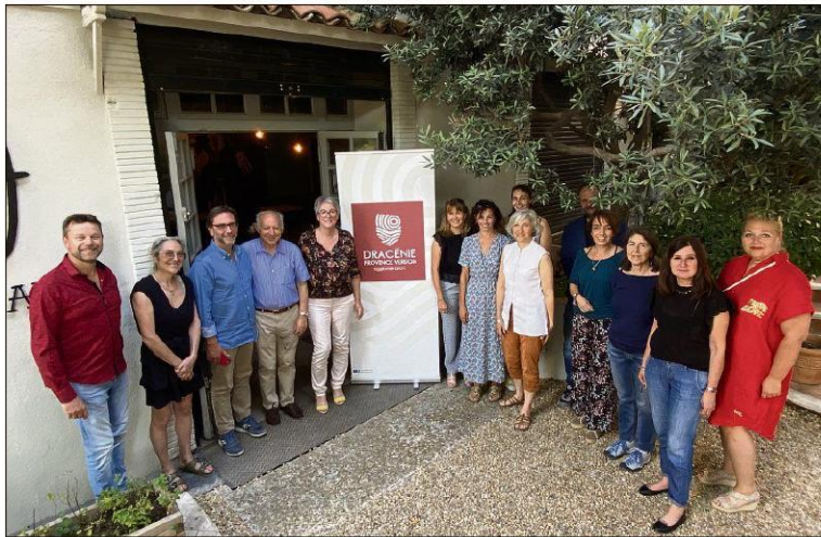
Ce projet européen vise à favoriser la croissance de la compétitivité et l'innovation des petites et moyennes entreprises dans le secteur du tourisme, par l'amélioration de leur accessibilité.

Concrètement, il s'agit, pour l'ensemble des acteurs impliqués dans ce dispositif, d'évaluer ce qui se fait ailleurs et d'éventuellement prendre exemple, pour ensuite pouvoir l'appliquer à son échelle. Chaque territoire étant accompa-