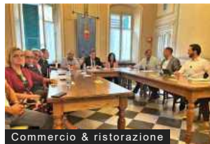
Commercio & ristorazione

Camera di commercio Riviera: help desk per il Mercato telematico dei prodotti ittici