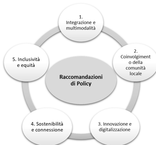
Figure 5 Systèmes de capitalisation du projet MOBIMART PLUS : Recommandations sur les lignes de conduite (Source : groupe de travail UNIGE-CIELI).

particulière aux lignes de conduites relatives à la structuration des services, du ticketing et de la tarification (système tarifaire unifié et intégré).