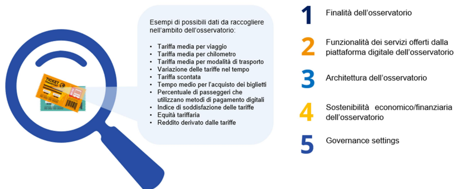
Figure 4 Systèmes de capitalisation du projet MOBIMART PLUS: « Observatoire » pour le suivi des systèmes de tarification.

demandé à la personne questions « filtres », « à s'exprimer en ce qui Observatoire relatif au suivi le cadre du projet