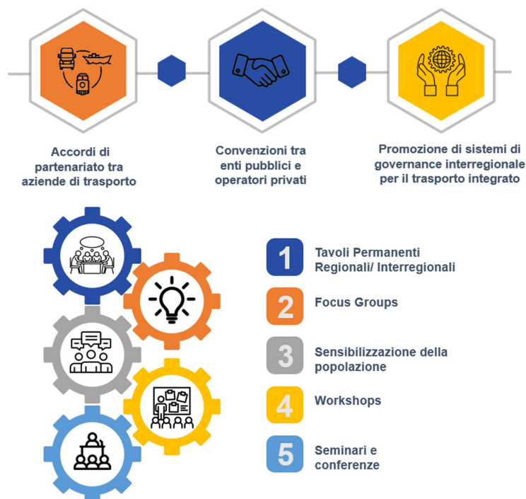
Figure 2 Sistèmes de capitalisation du projet MOBIMART PLUS: Modèles pour la mise en œuvre d'accords/outils (Source: groupe de travail UNIGE-CIELI).