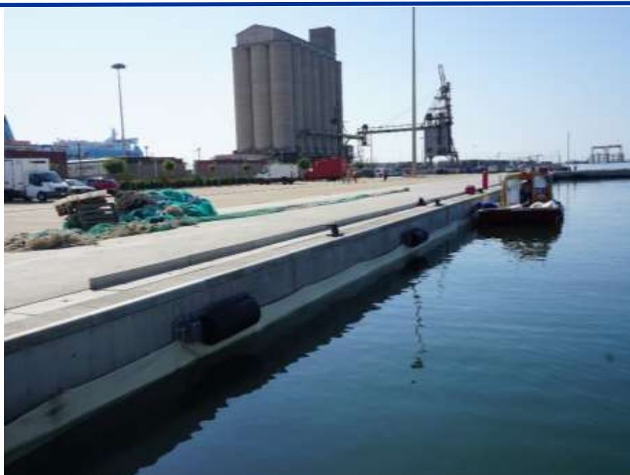
Figure 3. Installation de bannières le long d'un quai

Zone équipée pour l'utilisation d'un produit à faible coût à impact environnemental réduit pour le confinement et l'élimination des polluants rejetés dans la mer – T2.2