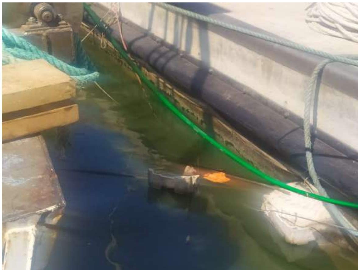
Figure 8. Détail de bannière détérioré

On suppose qu'une série de facteurs tels que la forte excursion du niveau de la marée qui submergeait périodiquement les bannières (également visible sur la figure 6), les températures élevées de la période estivale et la forte concentration dans les eaux portuaires de nutriments tels que l'azote et le phosphore que favorisent la prolifération intense des algues, ont contribué à la dégradation soudaine et inattendue du matériau.