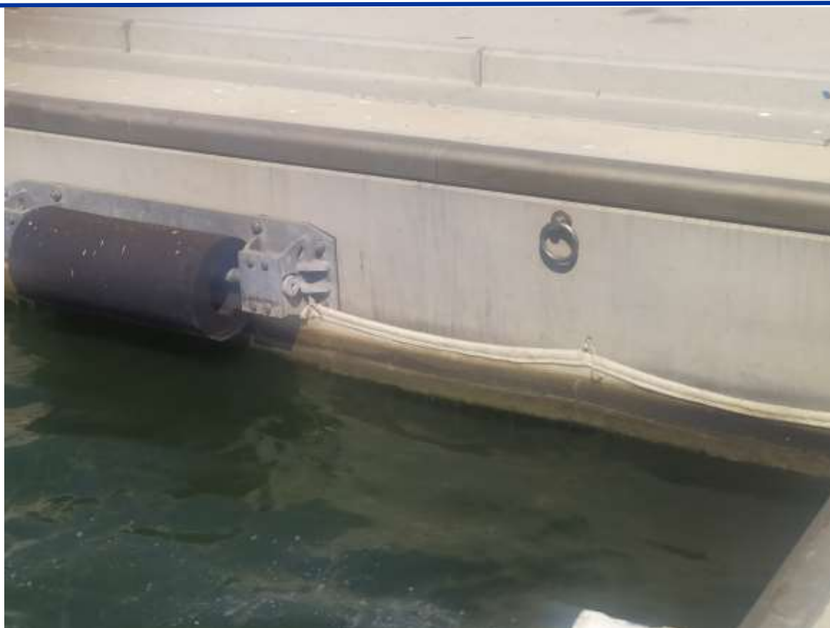
Figure 7. Détail de la bannière détérioré et ligne de rupture claire visible

Zone équipée pour l'utilisation d'un produit à faible coût à impact environnemental réduit pour le confinement et l'élimination des polluants rejetés dans la mer – T2.2