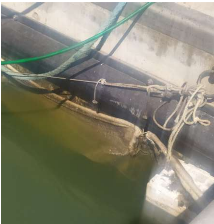
Figure 9. Point d'échantillonnage de la bannière

Afin de rechercher les causes de la dégradation rapide observée entre les mois de juillet et août, il est prévu de réaliser une nouvelle installation en période hivernale. UNICA effectue actuellement un suivi de la qualité de l'eau sur site afin d'évaluer l'évolution des caractéristiques de qualité des eaux de mer du port, également après la mise en œuvre de l'action pilote. En outre, le 11 septembre 2020, certains échantillons de banderoles ont été prélevés (à partir du seul point où ils sont restés intacts pendant une période plus longue) pour être soumis à des analyses chimico-microbiologiques (figures 9 et 10).