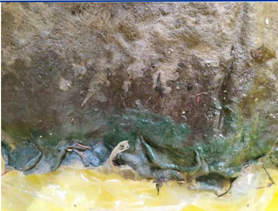
Figure 10. Échantillon de bannière en cours d'analyse

Dans le même temps, des activités de recherche ont été lancées dans les laboratoires de la Faculté d'Ingénierie de l'Université de Cagliari pour la vérification, à l'échelle du laboratoire, des performances du matériau. En particulier, des tests respirométriques ont été lancés à l'aide d'un respiromètre statique automatique Sapromat (Figure 11) pour évaluer la biodégradabilité de la bannière avant et après utilisation, avec et sans contaminants, en déterminant l'oxygène consommé par les micro-organismes.