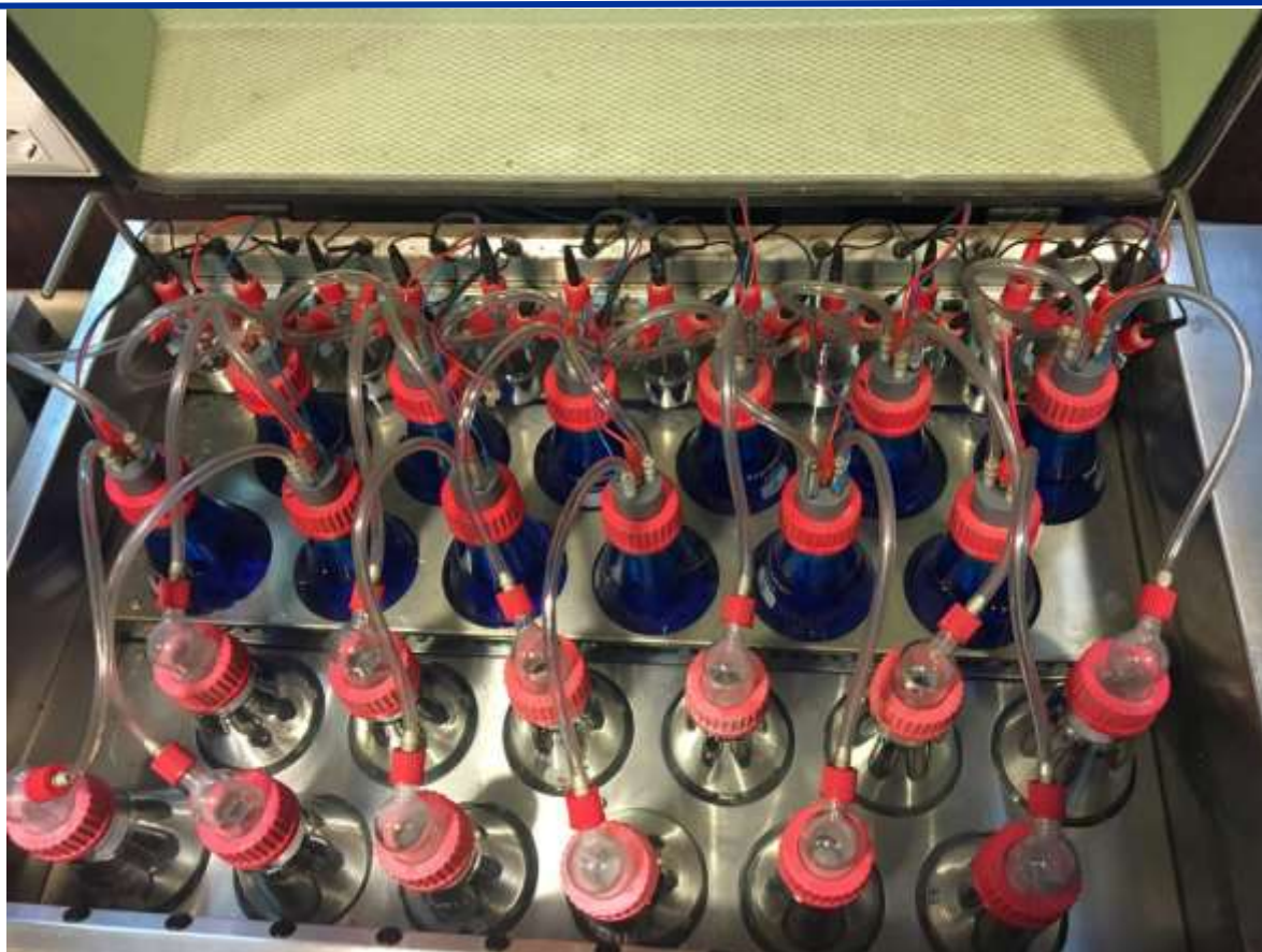
Figure 11. Configuration du réacteur pendant un test respirométrique

Zone équipée pour l'utilisation d'un produit à faible coût à impact environnemental réduit pour le confinement et l'élimination des polluants rejetés dans la mer – T2.2