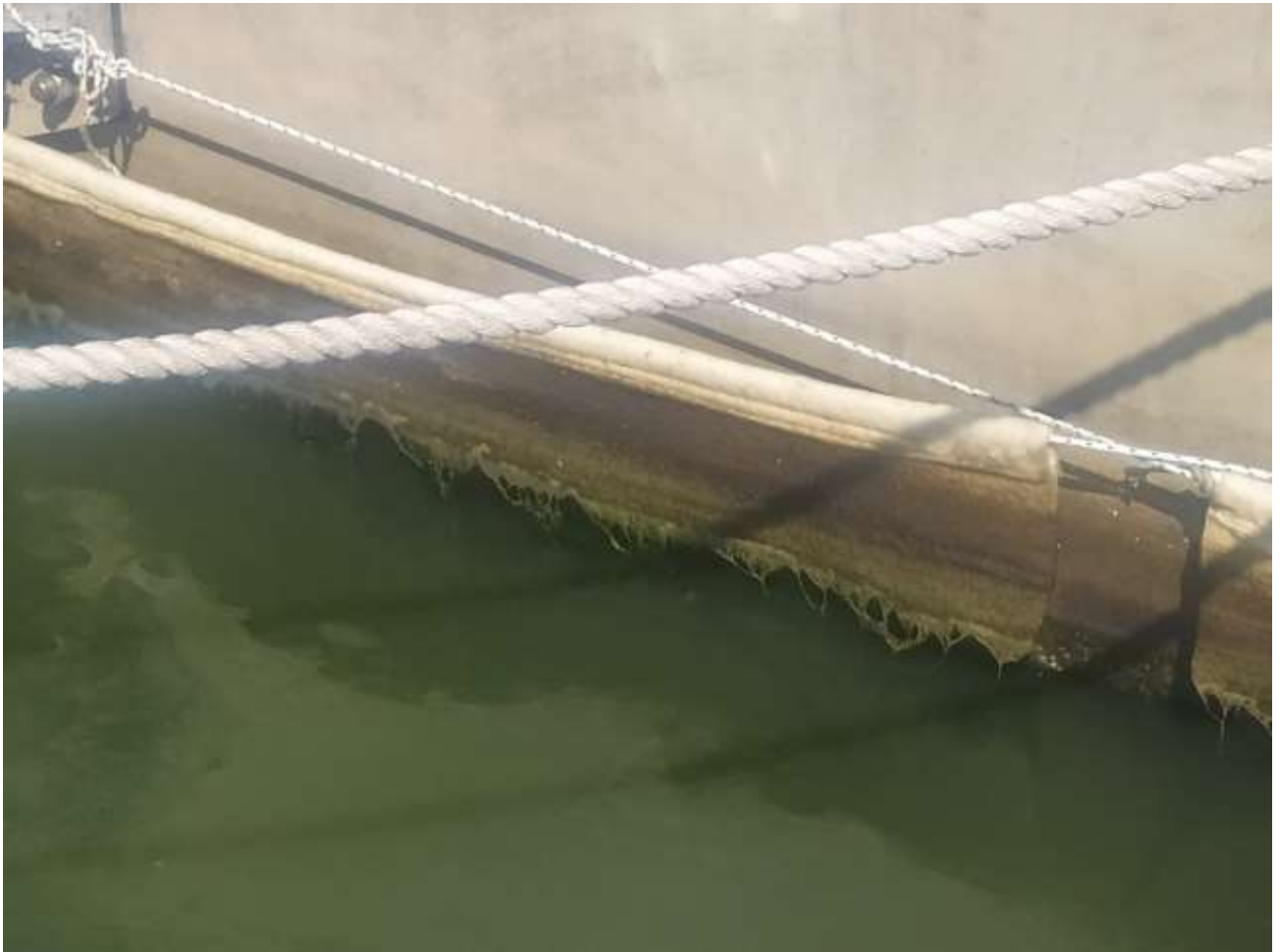
Figure 5. Détail de la détérioration de la bannière avec la colonisation des algues

En ce qui concerne l'état actuel de la zone équipée, il est à noter que, bien que les bannières aient été installées suivant les indications de l'entreprise qui les commercialise, après 15-20 jours la fin des travaux d'installation, les bannières étaient visiblement détériorées colonisée par les algues sur tous les tronçons du quai, comme le montrent les figures 5-8.