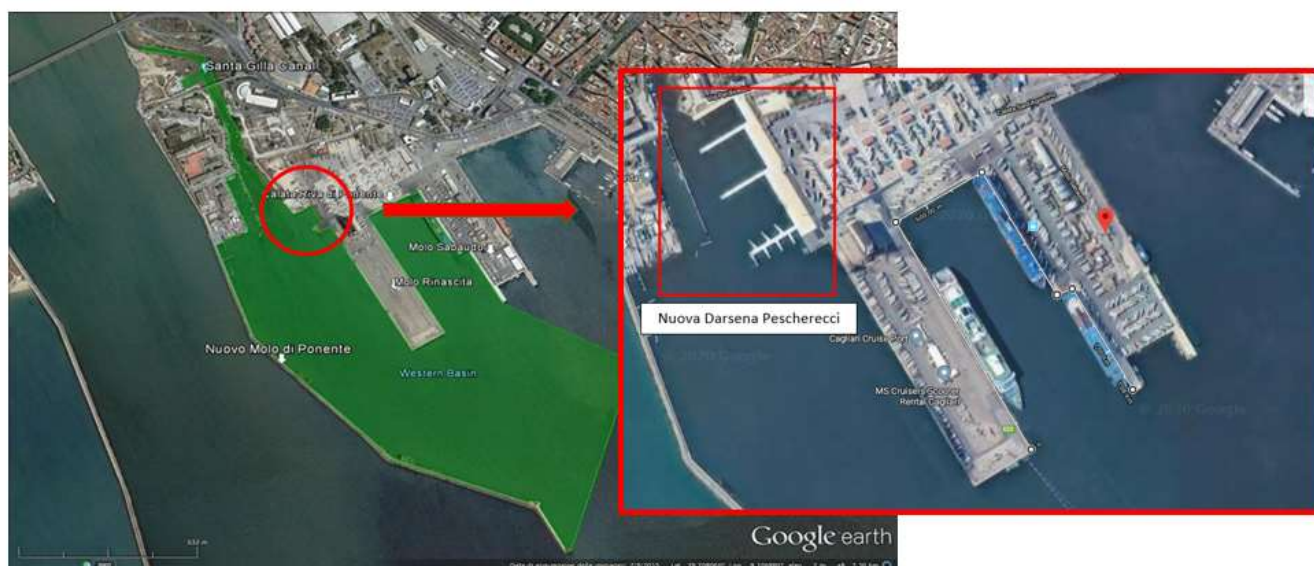
Figure 1. Localisation de la zone équipée pour la gestion des déversements accidentels au nouveau quai de pêche du port de Cagliari

Les bannière, réalisées avec un matériau absorbant naturel, écologique et recyclable, composé à 100% de fibres renouvelables, validées par le Ministère de l'Environnement pour la capacité d'absorption et la biodégradation naturelle (sans additifs ajoutés) des hydrocarbures pétrochimiques déversés en mer, sont ont été installés au nouveau quai de pêche (figure 1) du port de Cagliari, sur plus de 500 m de quai selon le schéma d'installation illustré à la figure 2 (bannières positionnées le long des sections surlignées en rouge). Les travaux d'installation ont commencé le 14 juillet 2020 et se sont terminés le 20 juillet 2020.