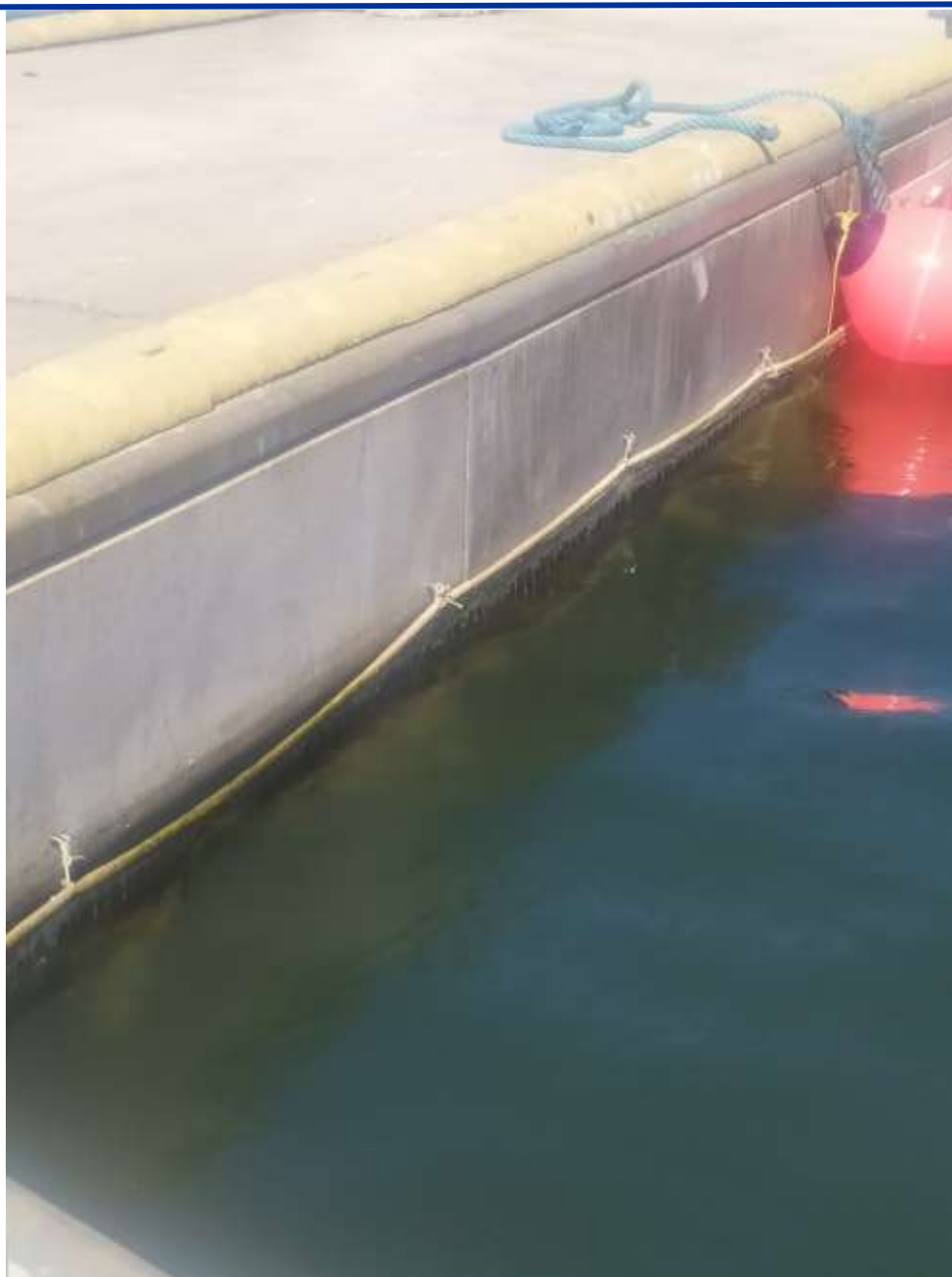
Figure 6. Bannière détériorée et niveau de marée haute

Zone équipée pour l'utilisation d'un produit à faible coût à impact environnemental réduit pour le confinement et l'élimination des polluants rejetés dans la mer – T2.2