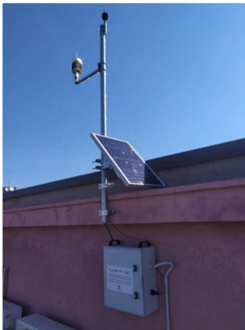
FIGURA 3: ESEMPIO DI STAZIONE DI MONITORAGGIO INSTALLATA NEL PORTO DI CAGLIARI.

all'interno del progetto viene messa a disposizione di quanti interessati alla realizzazione di sistemi di monitoraggio in altri porti, anche al di fuori dell'area di cooperazione.