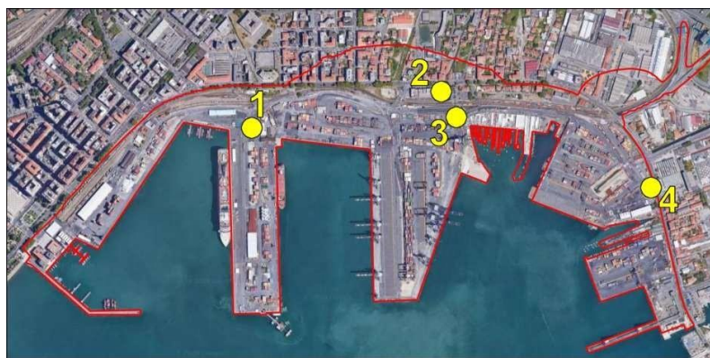
DEL SISTEMA DI MONITORAGGIO DI LA SPEZIA

Una volta stabilite tali posizioni, le autorità portuali partner del progetto MON ACUMEN hanno intrapreso l'iter di realizzazione delle reti di monitoraggio acustico (figura 3). Queste, realizzate secondo specifiche tecniche fornite dai partner scientifici, sono conformi con la normativa vigente e soddisfano richieste del progetto. Le prestazioni dei sistemi di monitoraggio sono state valutate parallelamente alla sostenibilità tecnico finanziaria. In questo modo l'esperienza maturata