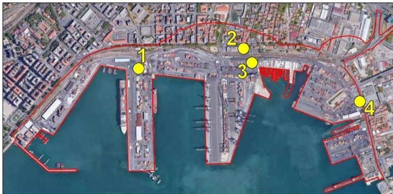
FIGURE 2: CHOIX DE POSITIONS POUR L'INSTALLATION DES STATIONS DE SURVEILLANCE DE LA SPEZIA

Une fois ces positions établies, les autorités portuaires partenaires du projet MON ACUMEN ont entamé la mise en place des réseaux de surveillance acoustique (figure 3). Celles-ci, réalisées selon les spécifications techniques fournies par les partenaires scientifiques, sont conformes à la réglementation en vigueur et répondent aux demandes du projet. Les performances des systèmes de suivi ont été évaluées parallèlement à la viabilité technique financière. Ainsi, l'expérience acquise dans le cadre du projet sera mise à la disposition des personnes intéressées par la mise en place de systèmes de contrôle dans d'autres ports, y compris en dehors de la zone de coopération.