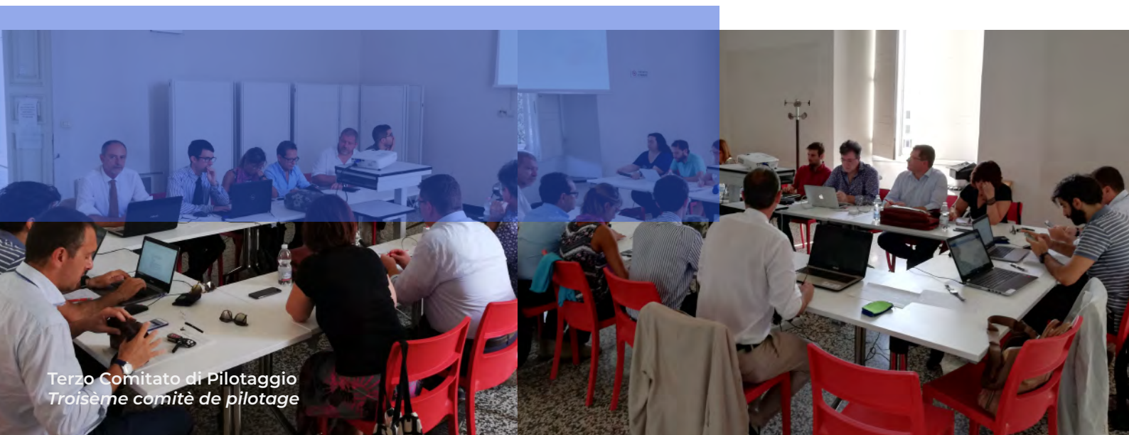
Terzo Comitato di Pilotaggio Troisième comité de pilotage

Le défi que le projet MON ACUMEN devra relever prochainement consiste à produire des cartographies acoustiques mises à jour et fiables en vue de la programmation et du développement portuaire. Les cartographies acoustiques indiquent les niveaux de bruit détectés pendant la journée, le soir et la nuit, et permettent d'identifier les zones présentant des problèmes majeurs et les lieux sujets au dépassement des niveaux maximums autorisés dans le classement acoustique. Les décideurs et les citoyens seront mieux à même de comprendre le phénomène, ce qui permettra par la suite de placer le réseau de monitoring en continu pour la détection constante des émissions sonores les plus importantes dans les ports concernés (pour rappel : Livourne, Piombino, Portoferraio, La Spezia, Bastia et Cagliari). À cet égard, il convient de