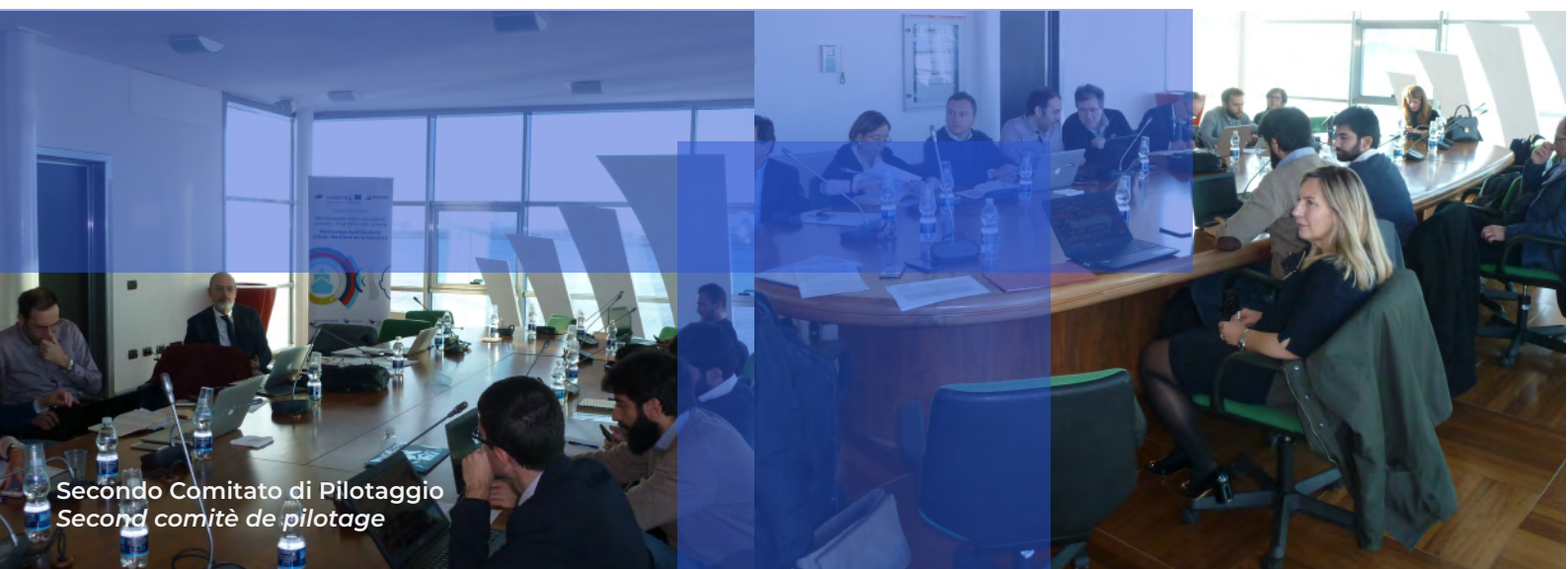
Secondo Comitato di Pilotaggio Second comité de pilotage

Au cours de la réunion, on souligne que le projet MON ACUMEN, conjointement aux autres projets financés par le programme IT-FR MARITIME sur le thème du bruit, a produit un cadre d'information complet des nuisances sonores dans l'aire de la coopération, utile également pour les territoires extérieurs au programme, ainsi qu'une série de documents techniques qui décrivent l'impact des ports sur la génération du bruit, facilitant ainsi la compréhension d'un phénomène complexe. Le travail réalisé jusqu'à