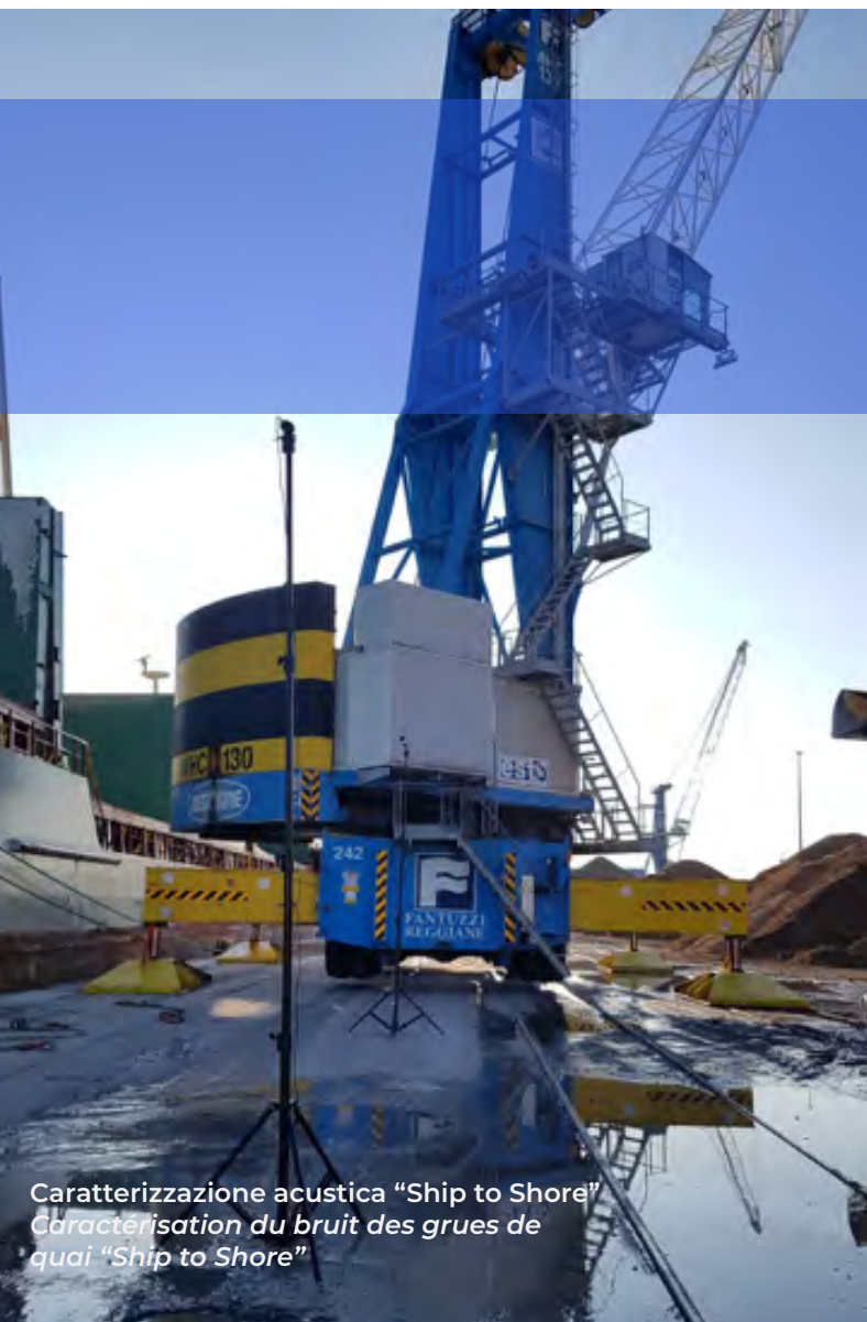
Caratterizzazione acustica "Ship to Shore" Caractérisation du bruit des grues de quai "Ship to Shore"

En outre, des mesures ont été réalisées au niveau de la navigation de plaisance : relevés phonométriques en continu, pendant une durée d'au moins 72 heures, afin de distinguer le bruit produit par le trafic de ce type de navigation du bruit généré par le trafic