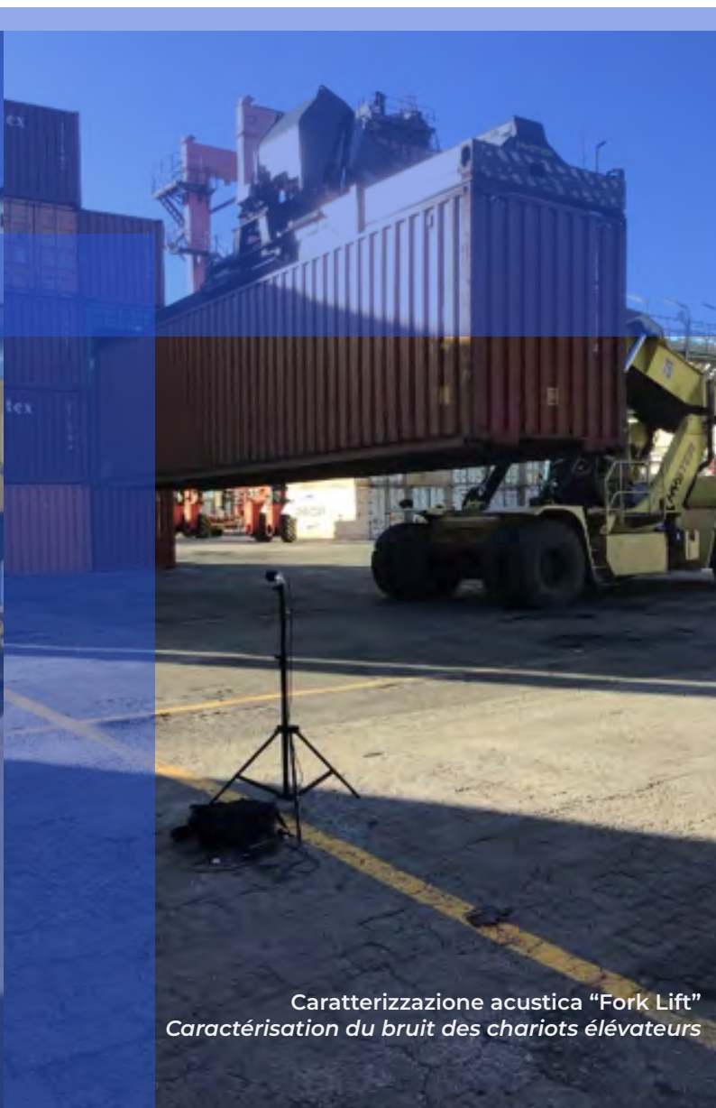
Caratterizzazione acustica "Fork Lift" Caractérisation du bruit des chariots élévateurs