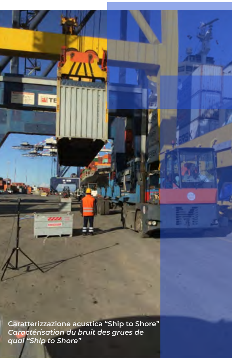
Caratterizzazione acustica "Ship to Shore" Caractérisation du bruit des grues de quai "Ship to Shore"

- mesure du bruit sur 3 navires de croisière au cours des phases d'arrivée, de stationnement à quai et de départ, de manière simultanée, d'une durée