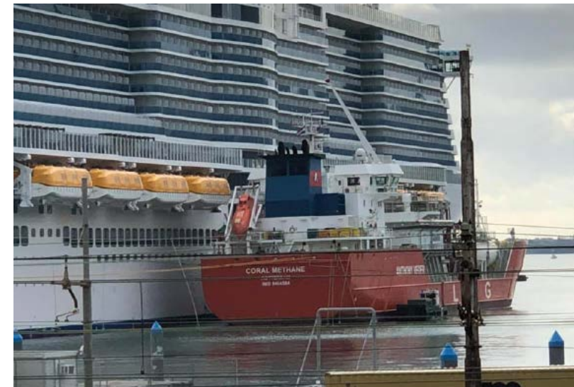
il primo storico rifornimento di gas naturale liquefatto sulla nave da crociera Costa Smeralda – La Spezia, ottobre 2020