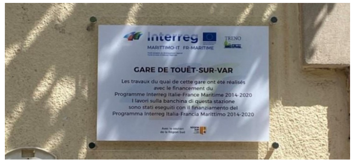
La plaque du projet dans la gare de Touët sur-Var

En plus des travaux infrastructurels sur les gares des trois chemins de fer, des actions de promotion et de valorisation des itinéraires ferroviaires et des territoires associés ont également été menées. En particulier, le fournisseur de la Région de la Sardaigne, la Fondazione Sardegna Film Commission, et le fournisseur de la Région Toscane, IMP.RI.IN. Srl, ont produit du matériel photographique et audiovisuel pour une diffusion transfrontalière.