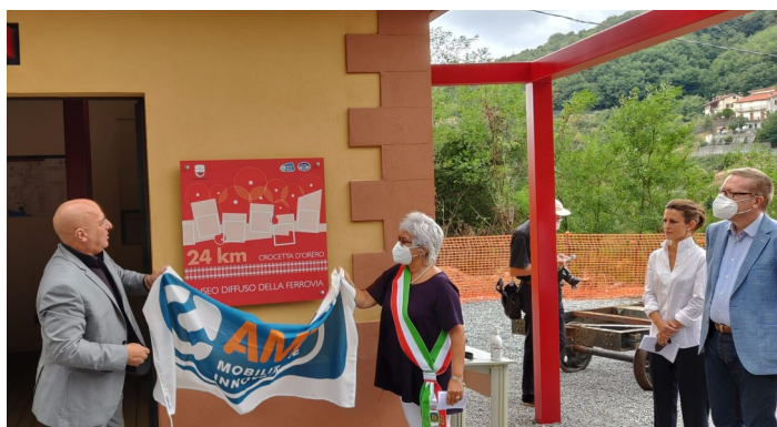
Inauguration du Musée de la gare de Crocetta