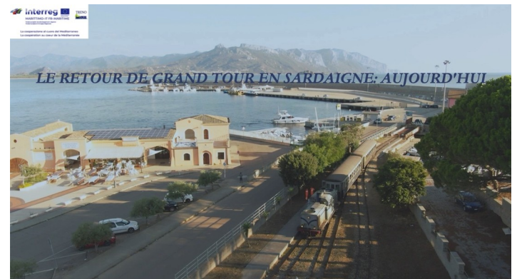
Couverture de la vidéo « Le Retour de Grand Tour en Sardaigne: aujourd'hui »