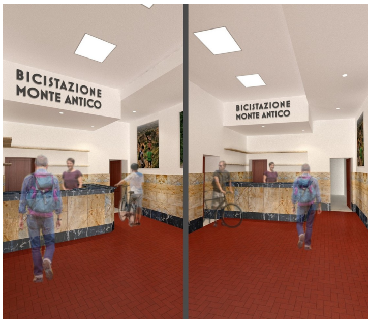
La simulation 3D de la station de vélo de Monte Antico