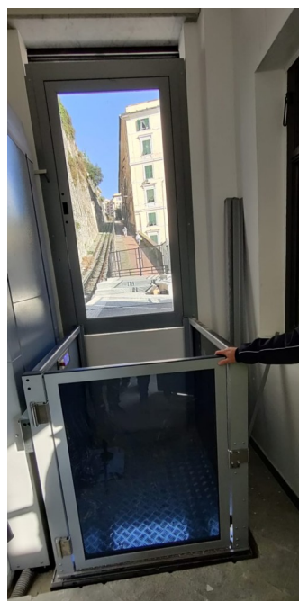
Travaux à la station Principe du Chemin de fer à crémaillère Principe-Granarolo