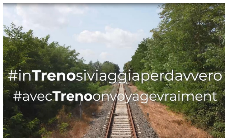
Le slogan émotionnel

IMP.RI.IN. Srl, au nom de la Région Toscane, a conçu et mis en œuvre un plan de promotion des itinéraires ferroviaires et des « capitales naturelles et culturelles » liées à ces itinéraires, par le biais d'actions de marketing touristique basées sur des contenus multi-média (audio et visuels) pour une interaction « sociale ». En particulier, en plus d'un ensemble de matériel graphique et photographique, une vidéo institutionnelle, deux vidéos de storytelling émotionnel et un « claim » publicitaire ont été réalisés. Ces produits visent à promouvoir un tourisme lent et durable, en harmonie avec la nature, l'histoire et la culture que traversent les lignes ferroviaires.