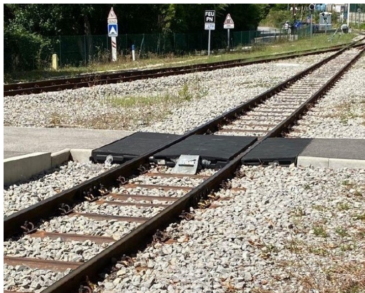
Les nouvelles traversées de voies dans la gare de Touët sur-Var

L'action pilote a été développée dans le but de renforcer l'attrait touristique du Train des Pignes. L'amélioration de l'accessibilité et de la facilité d'utilisation augmentera le nombre de touristes, notamment les personnes handicapées.