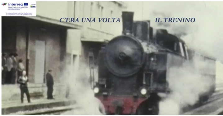
Copertina del video "C'era una volta il trenino".