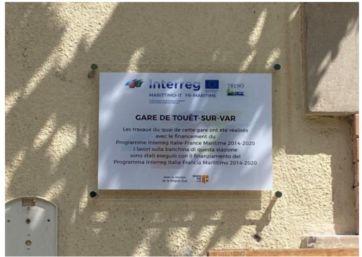
La targa del progetto nella stazione di Touët sur-Var

Oltre agli interventi infrastrutturali nelle stazioni delle tre ferrovie, sono state realizzate anche delle azioni di promozione e valorizzazione degli itinerari ferroviari e dei relativi territori. In particolare, il fornitore di Regione Sardegna Fondazione Sardegna Film Commission e il fornitore di Regione Toscana IMP.RI.IN. Srl hanno prodotto dei materiali fotografici e audiovisivi da diffondere a livello transfrontaliero.