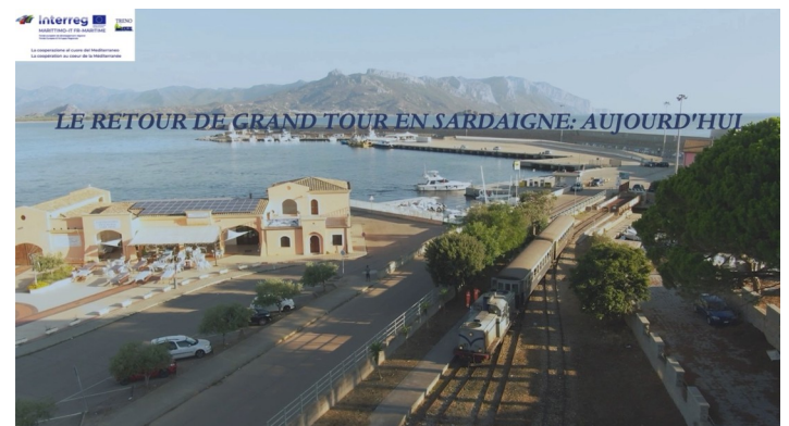
Copertina del video "Le Retour de Grand Tour en Sardaigne: aujourd'hui"