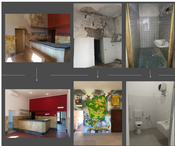
Lo stato pre e post intervento della stazione di Monte Antico

Più precisamente sono stati ristrutturati tre locali che sono ora adibiti a bici-stazione ed officina e a punto informativo e di accoglienza per i viaggiatori. La rinnovata stazione, da cui parte anche il Treno Natura, costituisce un punto tappa importante della Ciclopista Due Mari e di tutti gli itinerari ciclistici ed escursionistici. Infatti la sezione locale della Federazione Italiana Ambiente e Bicicletta ha organizzato nei mesi scorsi un'escursione in bici, partendo dalla Stazione di Monte Antico per promuovere il turismo ciclistico.