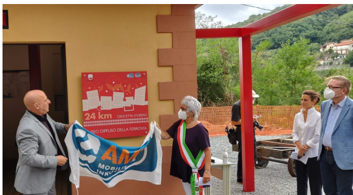
L'inaugurazione del museo diffuso della stazione di Crocetta