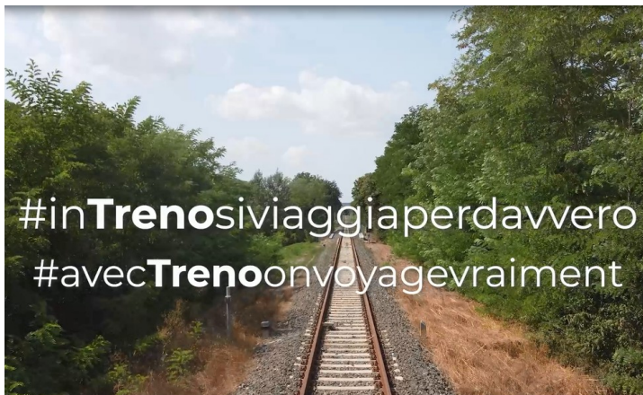
Lo slogan emozionale

IMP.RI.IN. Srl, su incarico della Regione Toscana, ha progettato e attuato un piano di promozione degli itinerari ferroviari e dei "capitali naturali e culturali" collegati a tali percorsi, attraverso azioni di marketing turistico basate su contenuti multimediali (audio e visual) per l'interazione "social". In particolare, oltre ad un set di materiale grafico e fotografico, sono stati realizzati un video istituzionale, due spot storytelling emozionali e un claim. Tali prodotti hanno lo scopo di valorizzare un turismo lento, sostenibile, in armonia con la natura, la storia e la cultura che viene attraversata dalle linee ferroviarie.