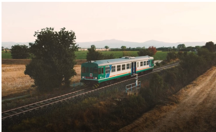
Un'immagine da uno spot emozionale