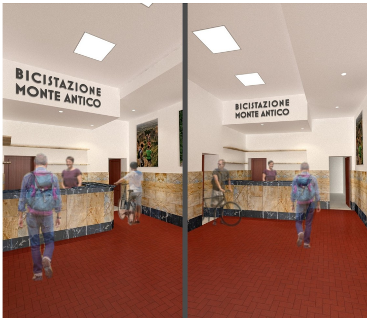
La simulazione 3D della bici stazione di Monte Antico